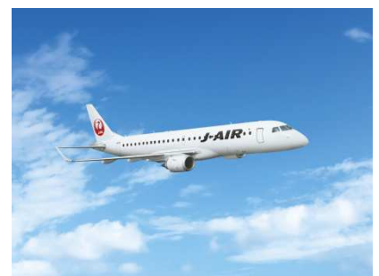
エンブラエル 190 型機