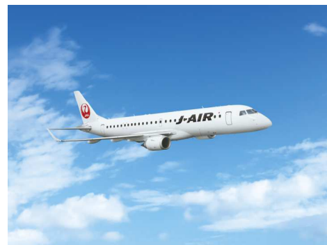
エンブラエル 190 型機