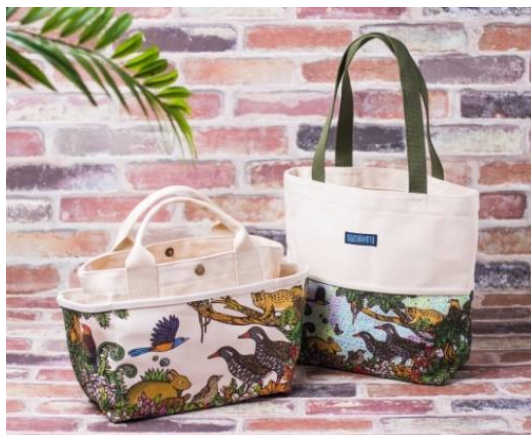
世界遺産応援バッグ 沖縄、鹿児島県 奄美大島 生き物イラスト名称