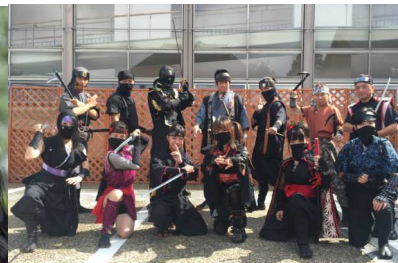
忍者ショーイメージ